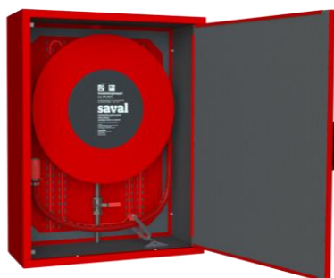
Achterwand opbouwkast (afgebeeld met montageplaat en ThermoLint)

Bij de Saval opbouw- en combikasten is een optionele geïsoleerde achterwand beschikbaar. Op de geïsoleerde achterwand is een voor gemonteerde steunplaat aangebracht, waarop de brandslanghaspel direct gemonteerd kan worden.