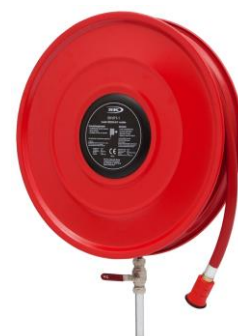
Saval Pro-build brandslanghaspel