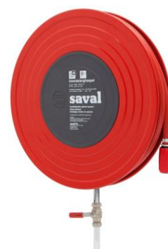
Saval Deco brandslanghaspel