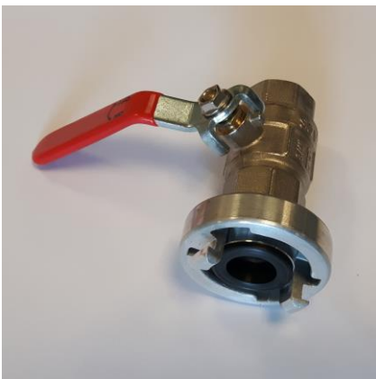
Storz aansluitset haspelwagen