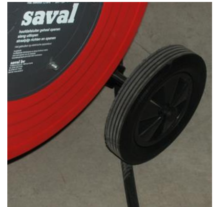
Probleemloos over obstakels